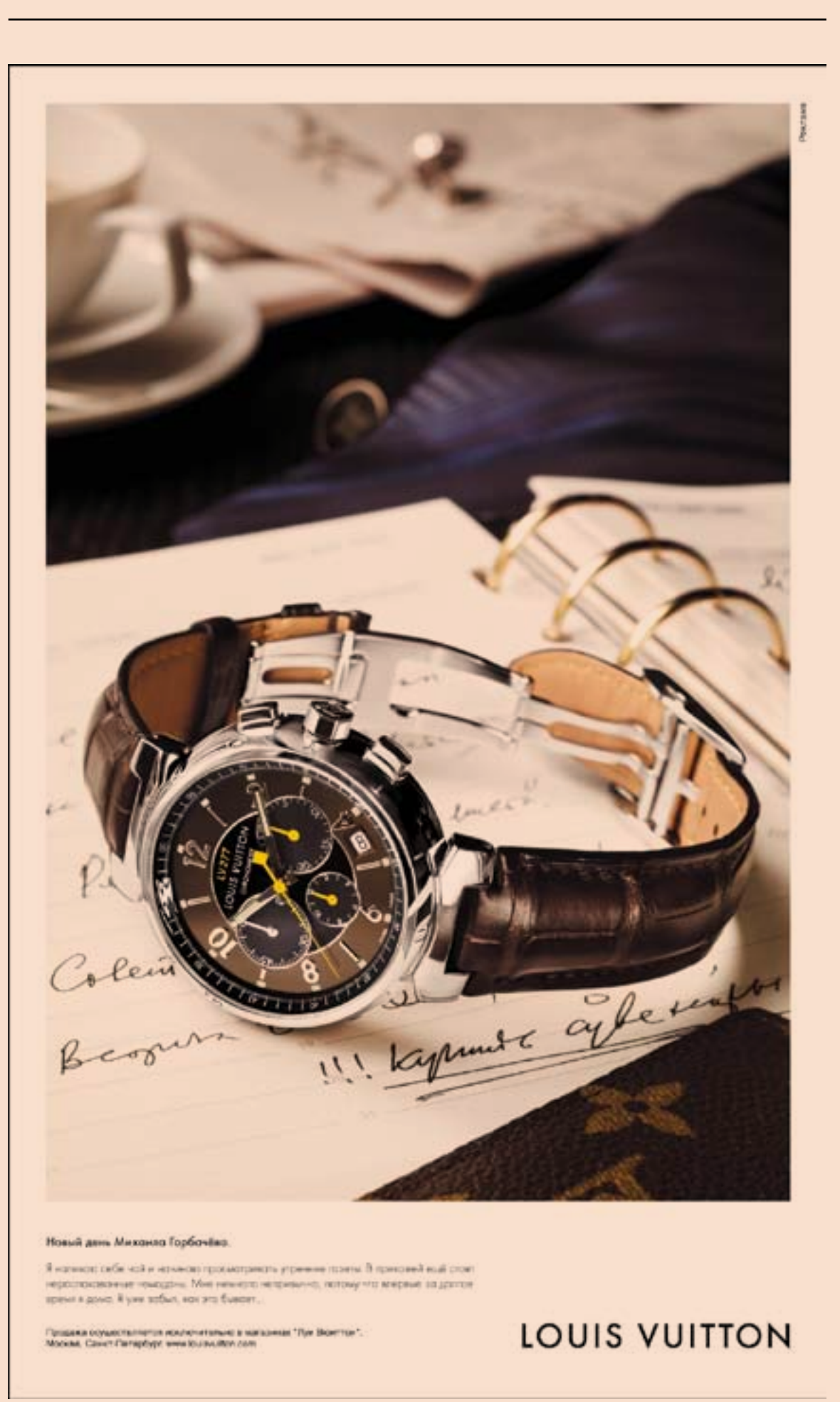
Новый день Михаила Горбачева.

Дела идут отлично, успокоил их Этьен. «На мой взгляд, только два французских региона оказались незатронутыми кризисом винодельческой глобализации – Шампань и Эльзас, – говорит он. – Так что в целом я расцениваю наши перспективы как очень хорошие».